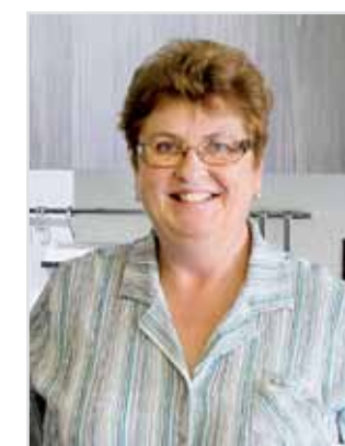
Petra Prühäuser Küchenstudio Prühäuser „Upcycling statt Recycling sind für Küche und Umwelt ein Gewinn.“